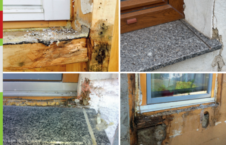
Wassereintritts-Schäden beim Fensterbankeinbau ohne FIXOTHERM.